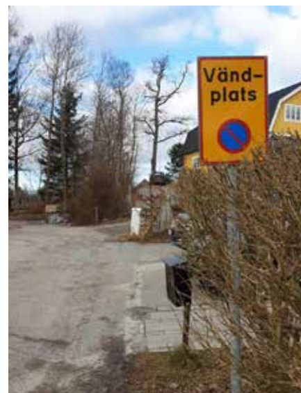
På en vändplats får man inte parkera.

Man kan betänka att Österskärs Vägforening är en av Sveriges största vägföreningar och arbetsbelastningen är i ständigt ökande.