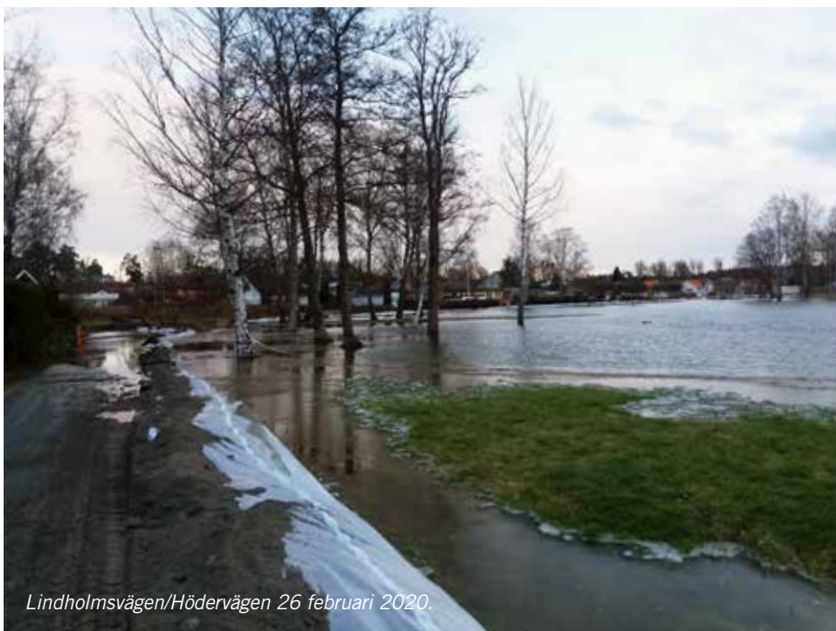
Lindholmsvägen/Hödervägen 26 februari 2020.