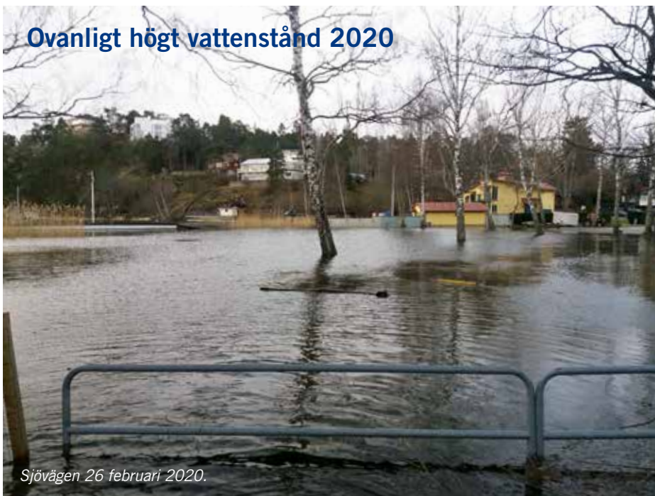
Sjövägen 26 februari 2020.